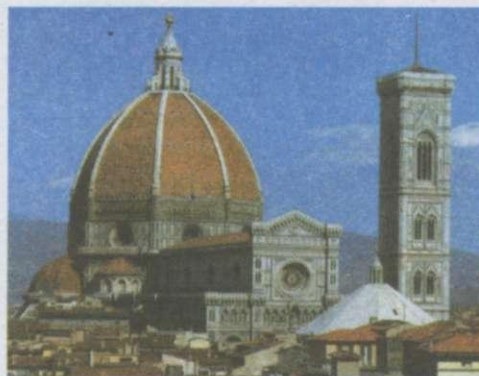
Кафедральний собор. Італія. Місто Флоренція. Купол. Розріз. Автор проекту Філіппо Брунеллескі Будівництво 1296—1436 роки.

2. Рекомендовані листи мають свою історію розвитку. Як кілька століть тому, так і нині, робітник, який приходить влаштуватися на нове місце роботи, вручає майбутньому роботодавцю документ, в якому відображається характеристика його трудової діяльності та особистісні якості. Без рекомендованого листа влаштуватися на престижну роботу практично неможливо.