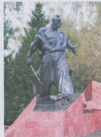
Пам'ятник Северинові Наливайку в Гусятині Тернопільської області. Скульптор Казимир Сікорський

■ Міжпредметні паралелі . Северин Наливайко народився в Гусятині (тепер район Тернопільської області), у молоді роки був на Запорозькій Січі, служив сотником у князя Костянтина Острозького, брав участь у розгромі козацького війська під П'яткою, а 1594 року став отаманом незалежної козацької дружини. Спільно із запорозькими козаками Наливайко очолив повстання проти наймогутнішої на