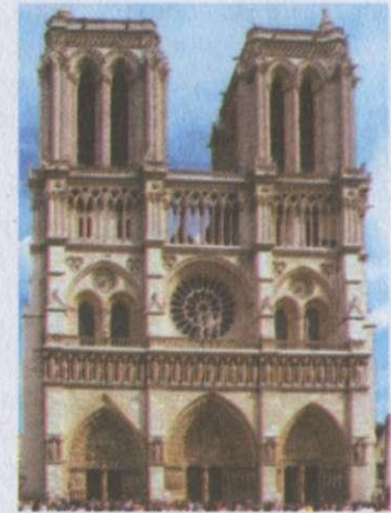
Собор Паризької Богоматері

Проблема художньої умовності. Чимало читачів переконані, що художній твір — прямий аналог життя, тож єдиний спосіб його зображення — форми самого життя. Вони сприймають художній світ буквально, визнають тільки реалістичне моделювання дійсності, відкидаючи умовні форми, забуваючи, що умовність загалом — один із законів мистецтва. Дивлячись п'єсу на сцені, глядач погоджується з тим, що бачить: сприймає умовність декорацій, голосно проголошені актором монологи, хоча в житті людина, як правило, мислить мовчки. На умовності базується наша згода із всевіданням автора прозового твору, перенесенням дії з одного простору в інший, з епохи в епоху. У творенні картини світу важливу роль відіграє художній домісел, що буває правдивішим за емпіричний. Так виникає умовна, ілюзорна, фікційна, уявна дійсність. Мистецтво слова ніколи не обмежувалося єдиною, конкретно-побутовою формою відтворення світу. Письменник вдається до умовної образності, фантастики, гротеску, алегорії, символіки тощо. Часто митець використовує образи, явища, які не мають безпосереднього відповідника в дійсності: привид у «Гамлеті» Вільяма Шекспіра , чарівна шагренева шкіра у романі Оноре де Бальзака , гротеск та сон в однойменній поемі Шевченка не суперечать правдивому розумінню життя. У світовому письменстві ХХ століття до художньої умовності вдавалися Анатоль Франс («Повстання ан-