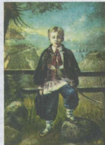
Ярослав Пстрак. Портрет хлопчика. Кінець XIX ст.

Здобувши диплом, у 1953 році Дмитро Васильович вступив до аспірантури, писав кандидатську дисертацію під керівництвом академіка Михайла Возняка . Предметом наукових студій Павличка стали сонети Івана Франка . Цього ж року вийшла його перша збірка «Любов і ненависть». За цю книгу на пропозицію Миколи Бажана автора 1954 року прийняли до Спілки письменників. Сам митець так пояснював назву книги: « Поезія творить любов, а не злоба... Якщо в моїх творах присутня ненависть, то це означає, що я жив у жорстокі і складні часи ». 1955 року померла мати, і це стало для поета тяжким ударом. До того ж, Дмитра Васильовича виключили з аспірантури начебто «за неуспішність», а насправді за виступ на зборах викладачів з критикою русифікаторської політики влади. Він почав працювати у журналі «Жовтень» (нині «Дзвін»), у 1957—1959 роках був заввідділом поезії. У 1955 році побачила світ збірка віршів