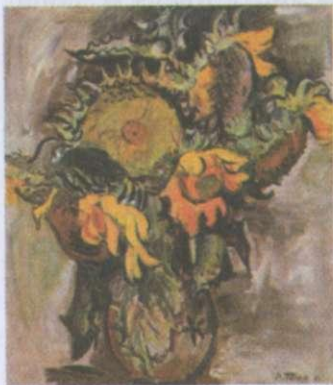
Володимир Патик. Соняшники. 1988

Національний характер балади виявляється на рівні поетичного мислення та образів. Зокрема,